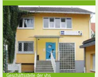
Geschäftsstelle der vhs

Ernst-Reuter-Schule: Dr. Heumann Weg 1 Weitere Kursorte mit Anschriften sind im Kursangebot genannt.